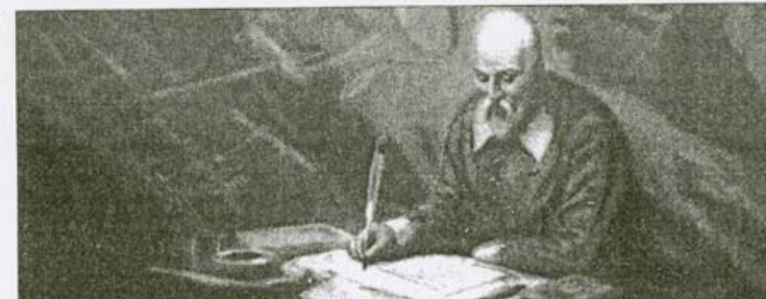
►► El autor: ► Cervantes en un cromo barcelonés, en torno a 1940.

durante estos cuatro siglos: un hombre flaco, con barba y bigote, acompañado de un escudero obeso.