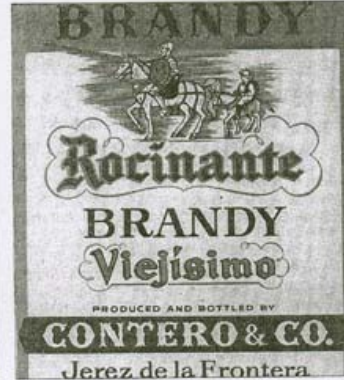
►► Anuncio: ► Brandy Rocinante.