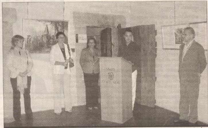
Momento de la inauguración de la exposición.

La exposición, patrocinada por la Institución Cultural El Brocense de la diputación, estará abierta hasta el 6 de noviembre.