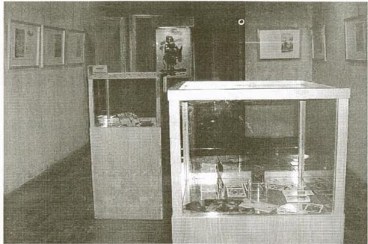
Grabados del siglo XIX, litografías de Mingote o barajas de cartas se entremezclan en la muestra.

Pero quizá sean los pequeños objetos, cotidianos, los que más han atraído a caurienses y turistas que se han asomado por el museo en el último mes. Tales como una colección de cajas de cerillas, que Fosforera Española distribuyó hacia 1970 y que ha sido cedida por un vecino de la ciudad. Como