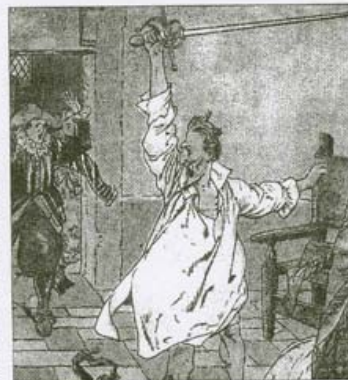
►► Dibujo: ► Cromo de Herovard, en 1910.