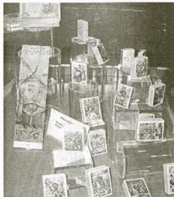
Colección decorada de cajas de cerillas. / A.P.M.