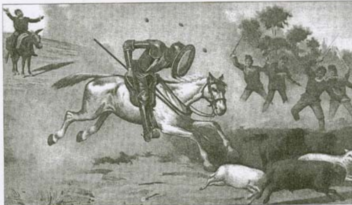
►► Escena: ► El ataque de don Quijote a las ovejas, en la versión de J. Alaminos, 1887.

La imagen de Alonso Quijano se ha mantenido casi invariable