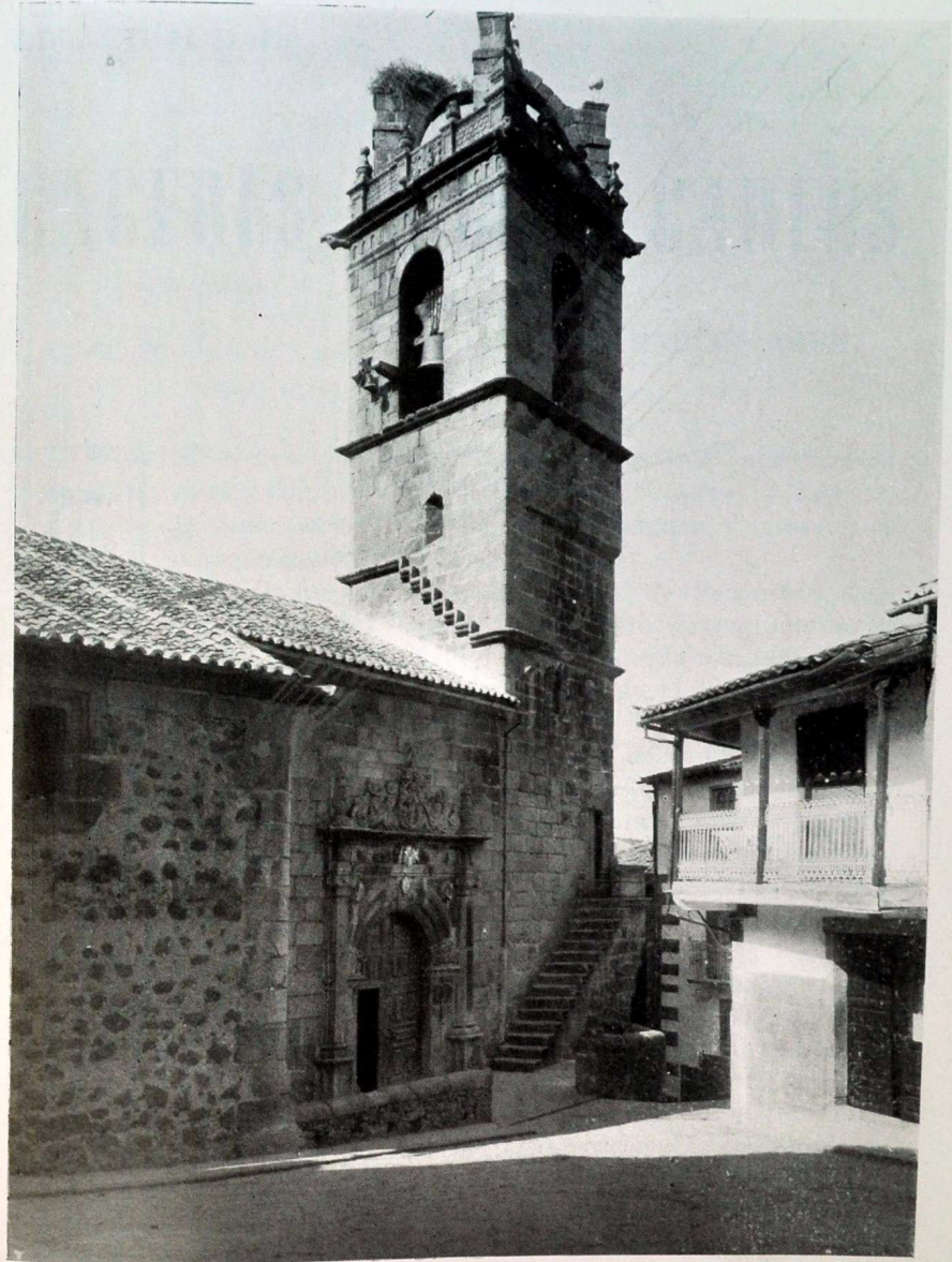
Arte extremeño. Iglesia de Baños de Montemayor