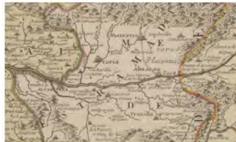
E.S. 10037.ADPCC / 04.03.56. // MAP 00006.

De las muchas ventas que figuran en los mapas hasta el siglo XVIII aún continúa en el mismo lugar la de las Herrerías (ahora con el nombre de Cruce de las Herrerías), cumpliendo la misma función que tuvo siempre.